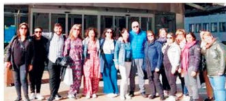
La delegazione Gli operatori della Locride presenti a Bruxelles

All'evento erano presenti i rappresentanti di diverse organizzazioni locali attive in ambito socio-culturale che hanno esposto i rispettivi piani di azione. Strutture che in contemporanea hanno